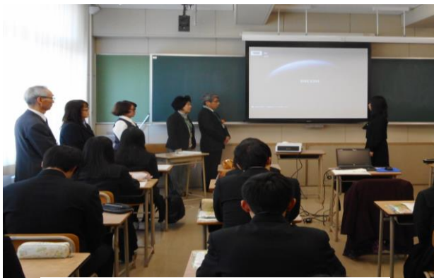
最後に代表生徒から、謝辞を述べました。