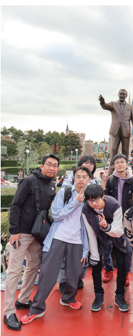
南 惺 大