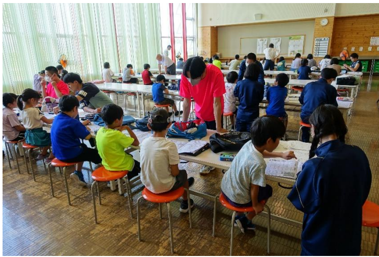
<7月26日(水) 沙留小学校(3年生3名サポート参加)>