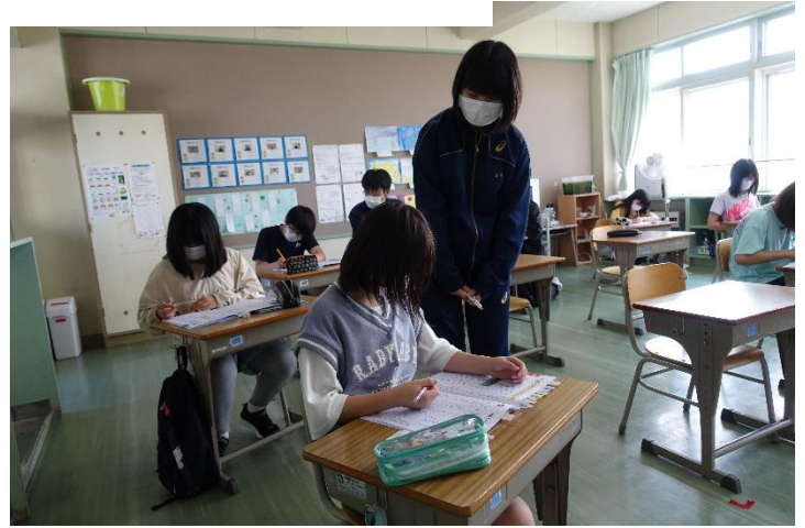
<7月27日(木) 興部高校での興部中学校生徒への学習サポート(公営塾講師および2年生1名サポート参加)>