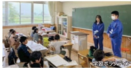
学習ボランティア

長期休業期間に地元の小中学校を訪問し学習ボランティアを実施しています。教えることを通して自身も気づきを得るとともに自己有用感を育てています。また、牛乳の里マラソンのボランティアなど地域の行事にも積極的に関わっています。