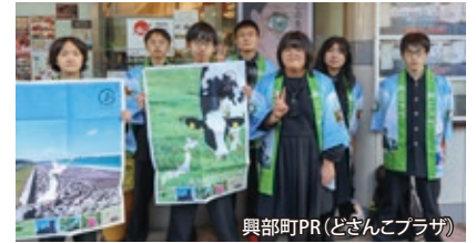
興部町PR(どさんこプラザ)