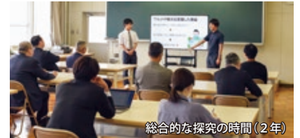
総合的な探究の時間(2年)

総合的な探究の時間では、おこっぺ町観光協会と連携し、地域を理解し、地域が抱える課題を考え、その解決を探る取組をしています。その成果として、見学旅行では興部町 PR を実施しています。